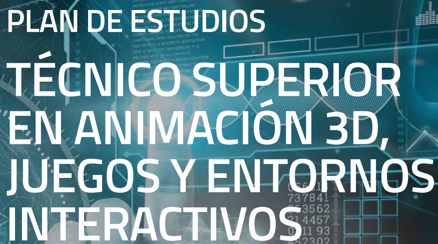
Imagen y Sonido